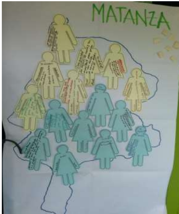
Resultados grupo focal